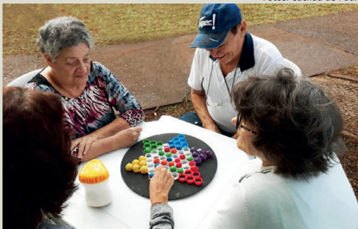
Alunos do UniversIDADE: Jogos que desafiam o cérebro

Jornal UniversIDADE - Qual foi a sua motivação para iniciar o Projeto Ecobrinquedoteca?