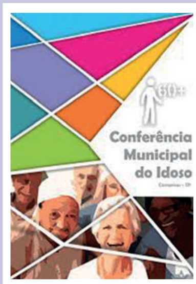
Reprodução da capa de material impresso distribuído na 8ª Conferência Municipal da Pessoa Idosa

O destaque ficou por conta do folheto entregue durante o