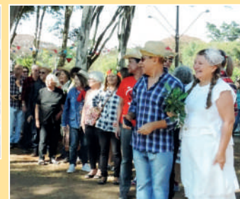
Oficinas e atividades realizadas em vários espaços da Unicamp